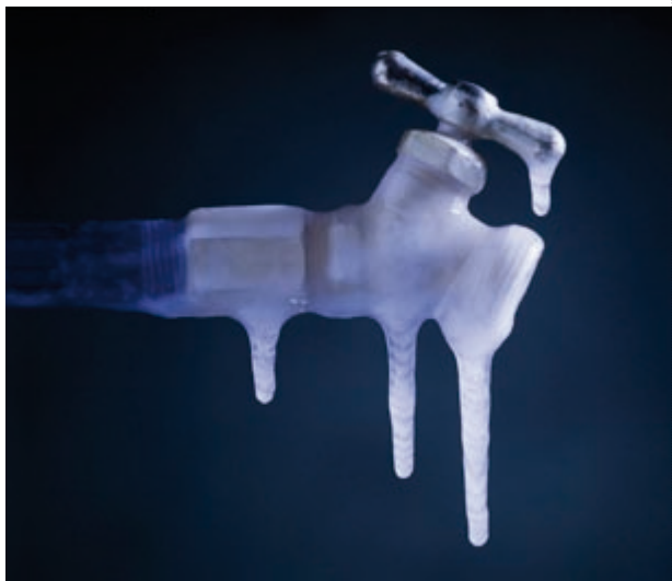
Wasserhahn „on the rocks“