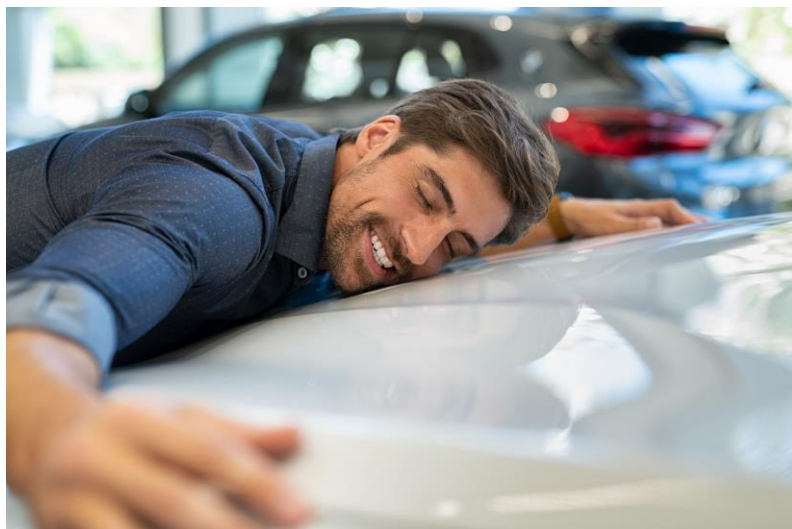
Die Deutschen lieben ihre Autos. Oder?